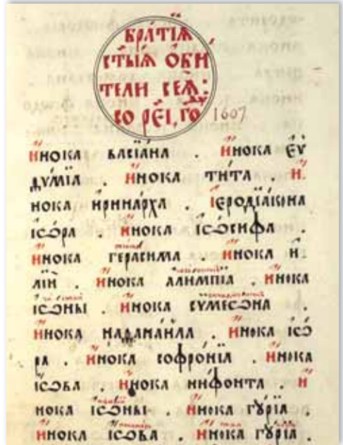
Синодик Новоспасского монастыря. 1725 год

В прошлом номере газеты мы рассказали о новой структуре в Русской Православной Церкви – Межсоборном присутствии. Недавно в Красном зале кафедрального соборного Храма Христа Спасителя состоялось очередное заседание президиума Межсоборного присутствия.