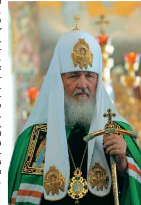
Из Напутственного слова Святейшего Патриарха Кирилла при вручении архиерейского жезла епископу Воскресенскому Савве

«Епископ должен уметь "наставлять в здравом учении и противящихся обличать" (Тит. 1, 7-9). Простые слова, сказанные от сердца, согретого живой верой и любовью к Богу, вызывают ответное доброе чувство у тех, кто их слушает, и действуют сильнее, чем речи, произнесенные по всем правилам ораторского искусства. Смысл церковной проповеди заключается в ее убедительности. Убедительность в Церкви – это не только сила логики и сила мышления. Это не только способность ссылаться на высокие авторитеты. Убедительность в Церкви – это в первую очередь искренность проповедника, способность его жизнь свою разделить с теми, для кого и ради которых он возвышает свой голос. С помощью увещаний и убеждений добивайся того, чтобы тебя слушали добровольно и с благодарностью. Всемерно старайся избегать конфликтов и распри, дабы быть в мире со всеми (Рим. 12, 18)».