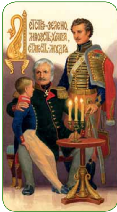
Иллюстрация из книги "Азбука в пословицах русского народа" изд. Новоспасского монастыря, художник С. Н. Ефошкин

Первая заключается в нарушении баланса правового и нравственного регулирования гражданских, общественных отношений. Наше общество заворожено словосочетанием правовое государство. При этом не замечается, что правовые нормы не могут описать все отношения между гражданами до мелочей. В правовом государстве важен